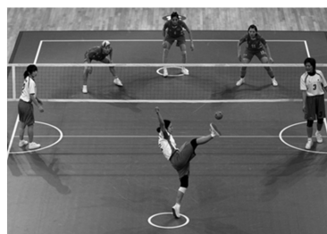
【図1】セパタクローの様子

の高さ（プレイヤーの胸の高さ）のネットの両側のコートに、各チーム3人のプレイヤーが並びます（図1）。各チームは、3タッチ以内にネットの反対側の相手コートにボールを送る必要があります。相手コートにボールが着地するとポイントが与えられます。この点は、バレーボールと同様です。各プレイヤーは、手以外の体の部位（頭、足、肩等）を使うことが許されます。これは、サッカーと同様です。